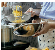
身体機能訓練 日常生活動作訓練 精神科訪問看護