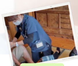
看護師による 健康状態の観察